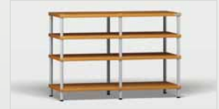
Trend 2 kirsch