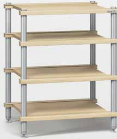
Audio 1 natur