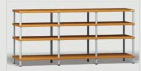
Trend 3 kirsch