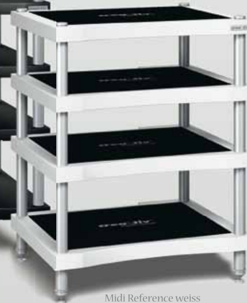
Midi Reference weiss