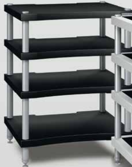
Little Reference schwarz