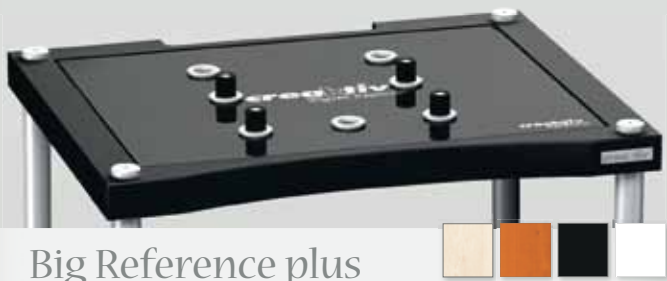
Big Reference plus