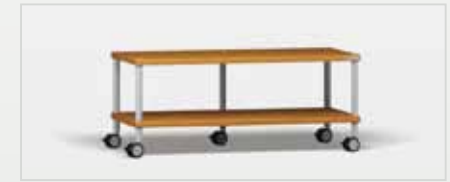
Trend TV kirsch