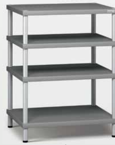
Trend 1 grau