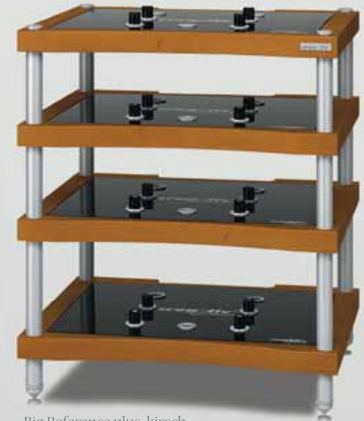
Big Reference plus kirsch